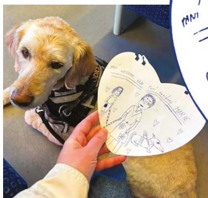
Děti pro nás malují také krásné obrázky. Na snímku vodící fenka Anny Burdové – Dixi.