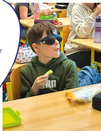
Děti si mohou například vyzkoušet, jak se najíst bez použití zraku.